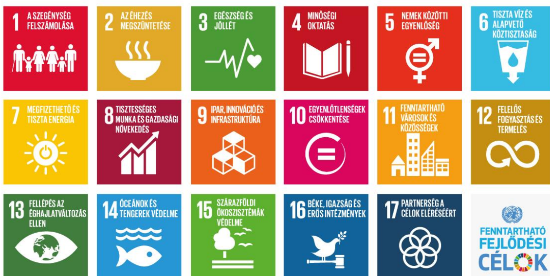
Fenntartható fejlődési célok

Pétfürdő célrendszere a 2015 őszén elfogadott Fenntartható Fejlődési Keretrendszer 1 és annak gerincét képező célrendszer végrehajtását, azaz a világ fejlődési pályájának fenntartható irányba állítását támogatja. A keretrendszer alapjait a kiegyensúlyozott társadalmi fejlődés, a tartós gazdasági növekedés és a környezetvédelem képezik. 2