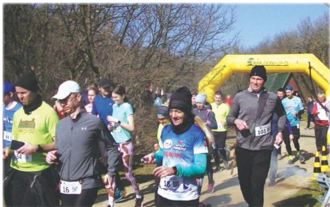
A Marathon Tömegsport és Környezetvédő Egyesületünk 2023. március 4-én rendezte az 53. Péti Terepfutóversenyt.