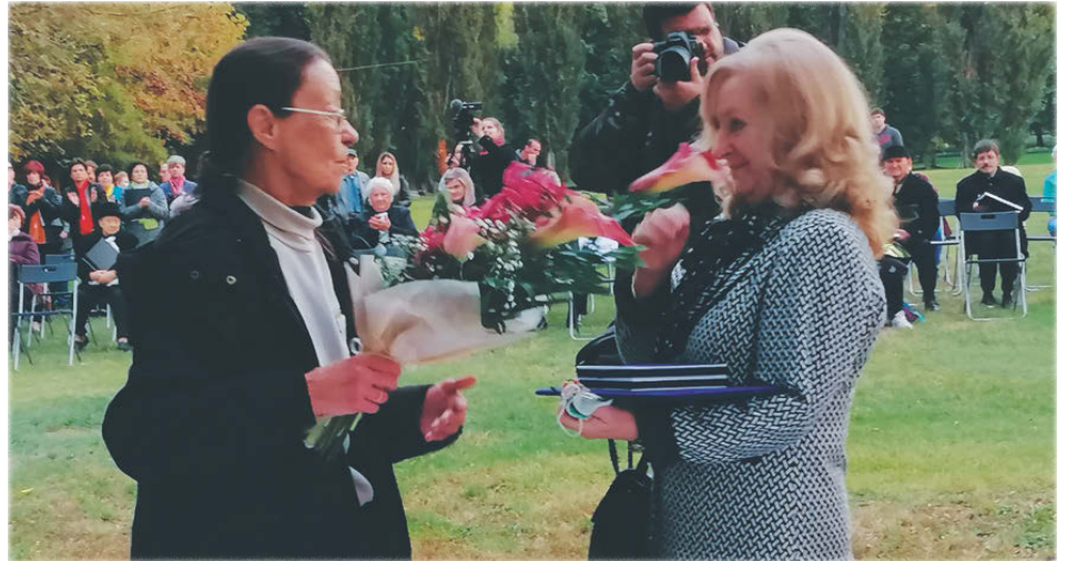
A kitüntetés átadása