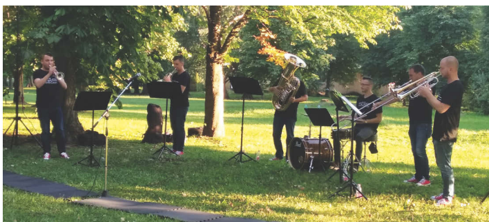
Savaria Rézfúvós Együttes