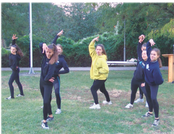
Dance Action SE