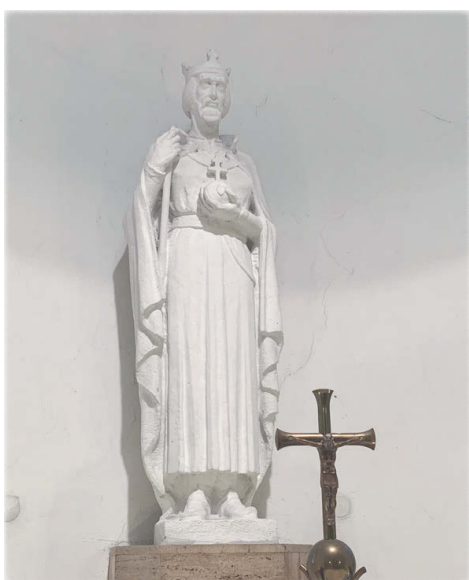
Szent László szoba a péti római katolikus templomban

...A koronát a templomban a fejemre tették, s mikor utána párnára helyezve, magam előtt vittem: új ceremóniát kezdtem. Ez az egész. A korona jelentését jobban, s mélyebben tudom, mint ahogy ti, koronával