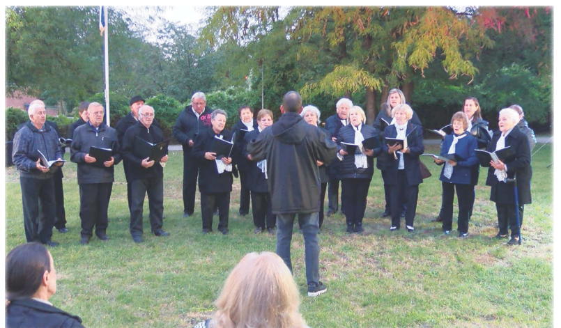
Szent László Kórus