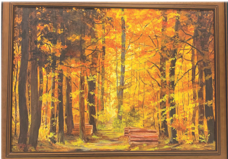
Gyórfy Zsuzsa: Pusztulunk, veszünk...