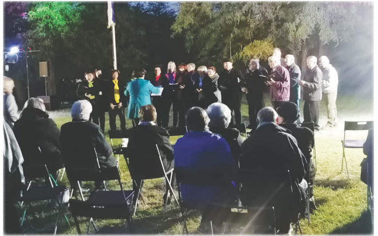
Napfény Női Kar, Péti Férfikar