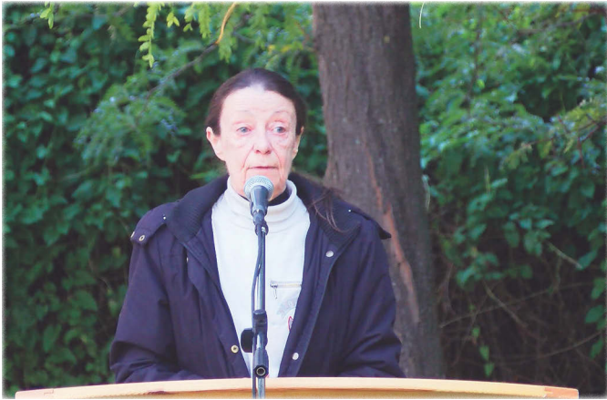
Horváth Éva polgármester

„...Ez a 24. alkalom, hogy összegyűlünk, hogy fényt adjunk mindenkinek, fényt, amit emberek alkotnak meg, és ami ma is apró lángokból fog összeállni. Október elsejét mi úgy hívjuk, hogy a Függetlenség napja. Minden évben megkérdezik