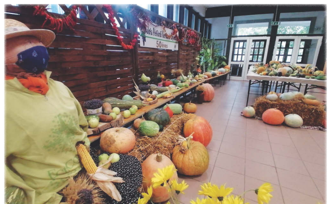
A kertbarátok tökkiállítása