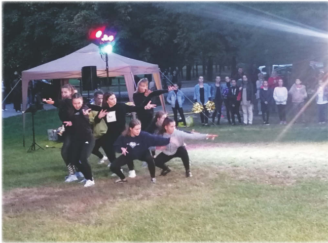
Dance Action SE