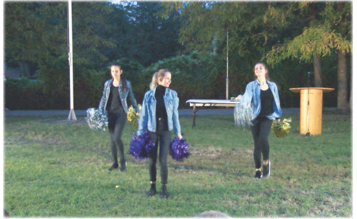
Eszterlác Mazsorett Együttes