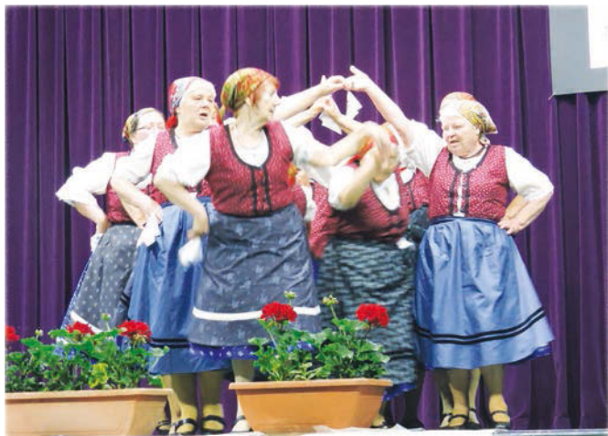
A Vadgalamb Néptáncgyűttes Hajmáskérről