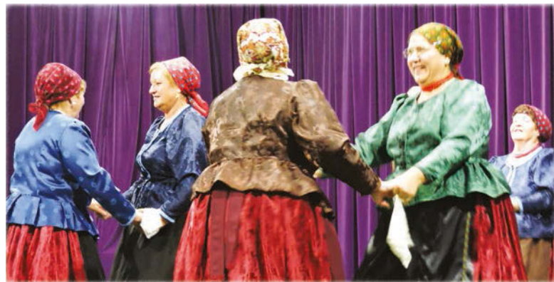
A Muskátli Táncgyűttes