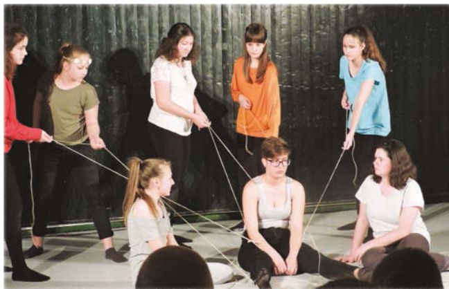
A magyarpolányi Alakváltó Kaméleonok

minősítést kapott. A Noszlopról érkező Atombomba csoport ezüst minősítéssel továbbjutott. A gyulafirátóti Hatások bronz minősítéssel gazdagodtak. A sümegi Rami-Szín az „Újszerű színházi formák” különdíjat kapta meg. A peremartoni Peresze bronz besorolást kapott. A szintén magyarpolányi Alakváltó Kaméleonok ezüst besorolást kaptak és továbbjutottak. A nap végén a zsűri konzultá-