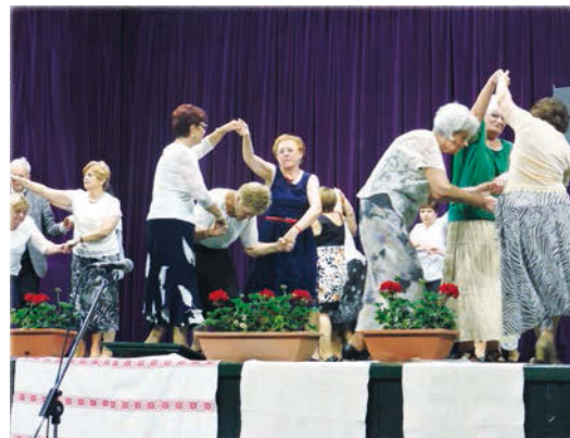
A Népek Tánca Csoport Veszprémből