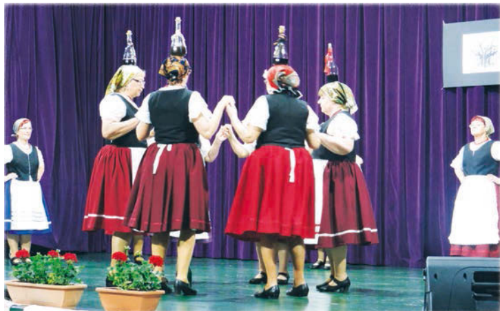
A veszprémi Cholnoky Jenő Nyugdíjas Klub