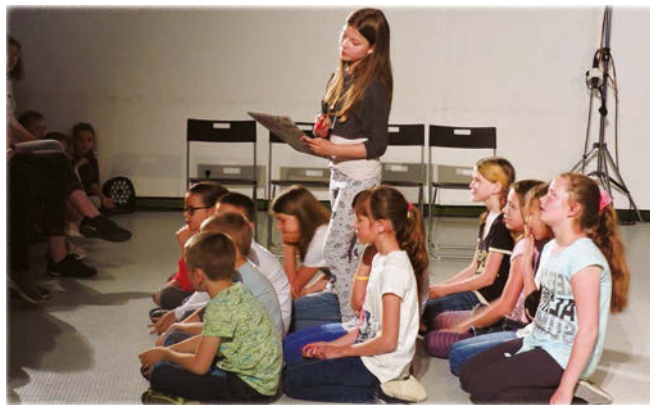
A noszlopi Atombomba csoport

velet kapott. A veszprémi CsozsiBoszik előadása ezüst minősítést érdemelt. A zirci Ma, mint Ti színházcsoport bronz