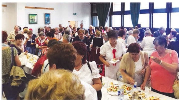
Állófogadás a találkozó után