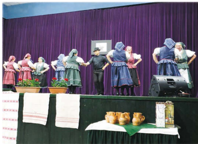
A Márkói Örökzöldek