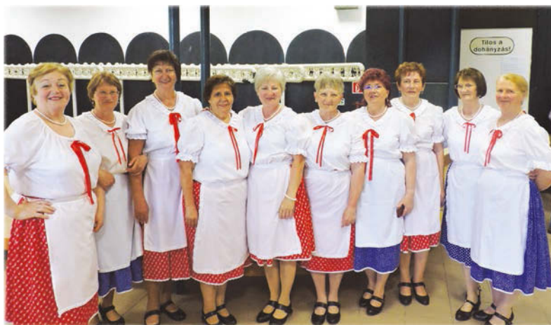
Az ajka-padragkúti Orchidea Tánc csoport