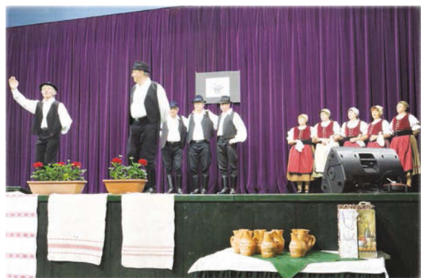
A Vörösberényi Nyugdíjas Klub Ringató Balaton Néptánc csoportja Balatonalmádiból