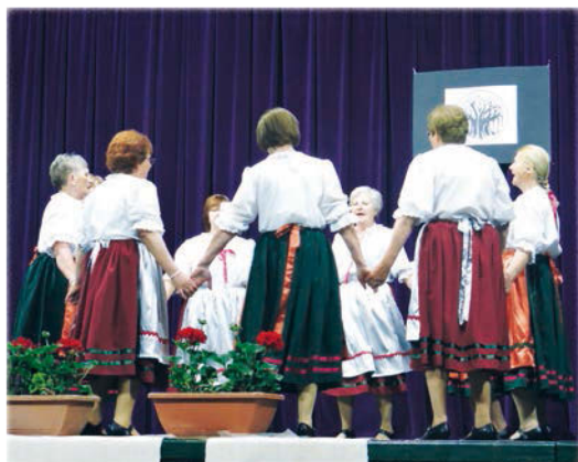
Az Ajka-Padragkút Baráti Kör-Rozmaring Csoportja

Veszprém harmadik képviselője a Bónuszévek Nyugdíjas