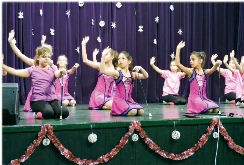
A Jázmin és a Százsorszép csoport