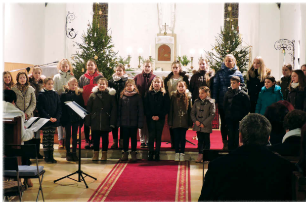
Az iskola énekara három karácsonyi dalt adott elő