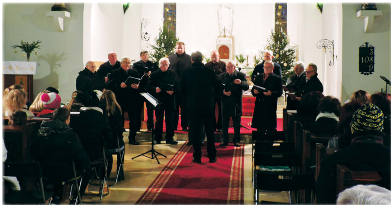
Elsőként a Péti Férfikar lépett a közönség elé