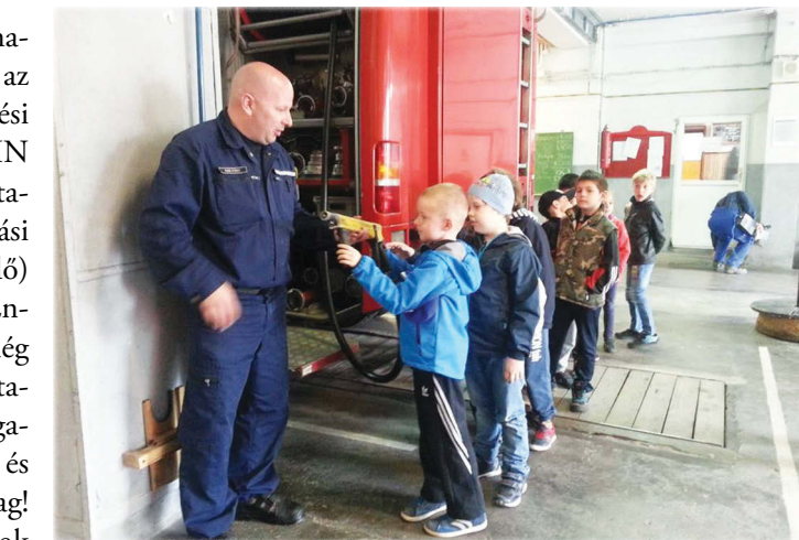
Iskolásaink a péti tűzoltóknál

Folyamatosan magas harmadik éve az SNI (sajátos nevelési igényű) és a BTMN (beilleszkedési, tanulási, magatartási nehézséggel küzdő) tanulók száma. Ennek tükrében még dicséretesebb a tavalyinál jobb magatartás, szorgalom és tanulmányi átlag! Következetesebbek vagyunk, és jobban figyelünk a gyermekekre: jó és rossz cselekedeteikre egyaránt reagálunk. Így nemcsak kellő számú figyelmeztetést, de nagyon sok dicséretet is adtunk az év során, ami motiváló hatású volt.