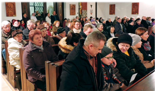
...majd a közönséggel együtt énekeltek a Mennyből az angyal című népéneket