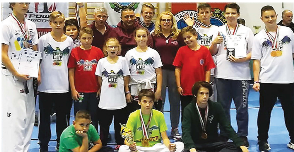
A péti taekwon-dosok

Az év márciusban a Magyar Bajnoksággal vette kezdetét, amelyen maroknyi csapatunk rendkívül jól teljesített, magyar bajnoki címet, illetve több érmet is szereztünk egyéni és csapat versenyszámokban is.