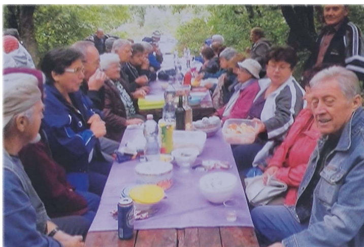
Az Albert pihenőnél

Áprilisban rendeztük meg először az „Életet az Éveknek” Országos Nyugdijas