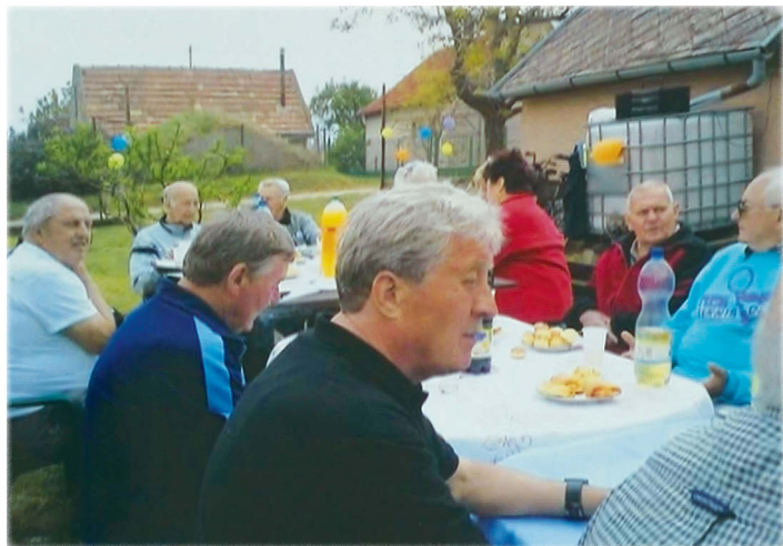
A Selmeczkői pincénél

Nagy megtiszteltetés érte a Muskátli Néptáncsoportot, megkapta a Pétfürdő Kultúrájáért díjat. Hajdúszoboszlón kétszer voltunk 3 napra kirándulni. A nyugdíjas Ki mit tud? mellett a prog-