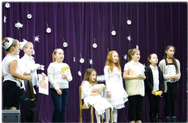
A Horváth István Általános Iskola hittanos tanulóinak pásztorjátéka