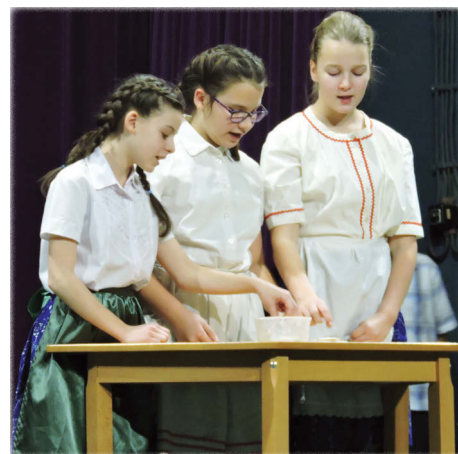
Az iskola 5. osztályos tanulói régmúlt idők karácsonyi szokásait elevenítették fel

csoportja adott elő karácsonyi verses-táncos műsort. A Muskátlai Táncegyüttes Rábaközi táncokkal lépett színpadra, majd a Horváth István Általános Iskola 5. osztályos tanulói régmúlt idők karácsonyi szokásait elevenítették fel. Az Eszterlánc Mazsorett Együttes Jázmin és Százsorszép csoportja legújabb, közös koreográfiáját mutatta be a közönségnek. A 2017-es falukarácsonyt a Szent László Kórus zenés-verses összeállítása zárta. A rendezvény végén pedig kicsi és nagy, fiatal és idős, együtt énekelte el a Karácsony ünnepén című dalt.