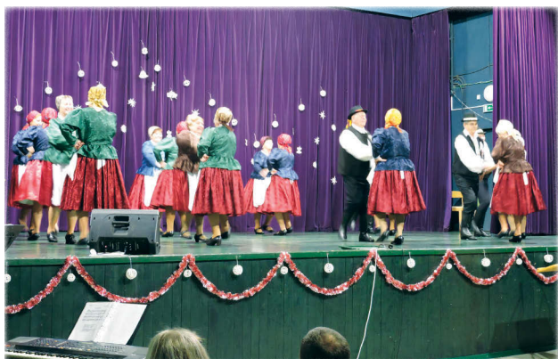
A Muskátlai Táncegyüttes Rábaközi táncokkal lépett színpadra