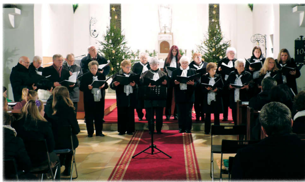
Az adventi koncert utolsó fellépője a Szent László Kórus volt