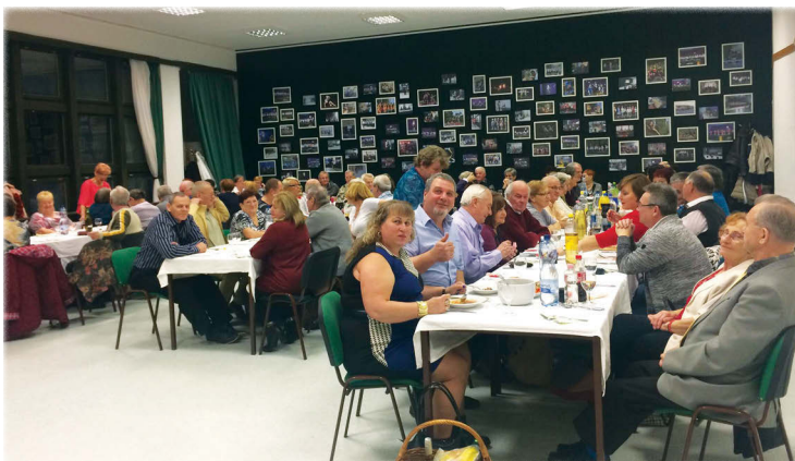
Jó vacsora, jó hangulat

Kolping Katolikus Szakközépiskola, Szakiskola és Kollégium diákjai főzték