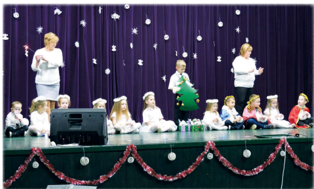
Az ovisok karácsonyi zenés-táncos műsort adtak elő