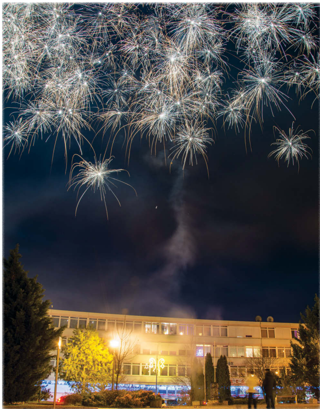
A tavalyi év utolsó – az idei év első pillanatai Pétfürdőn

Nem lehetséges, hogy az újévi fogadalmom csak egy kibúvó, amire hivatkozva még várhatunk? Év elejéig még ehetünk bátran, lustálkodhatunk, halogathatjuk a nagy döntéseket, nem kell meglépnünk az igazán fontos lépéseket. Minden ráér. »»»