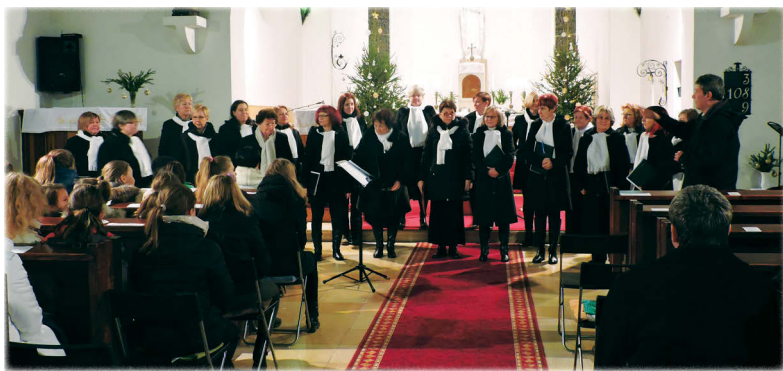
A Napfény Női Kar is énekel