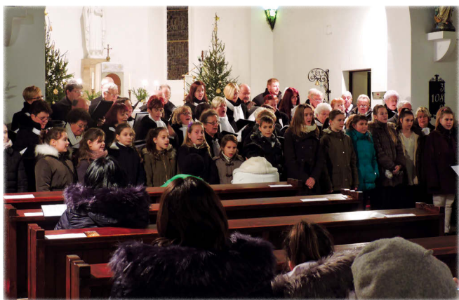
A hangverseny végén az összkar előadta a Menjünk mi is Betlehembe című dalt,