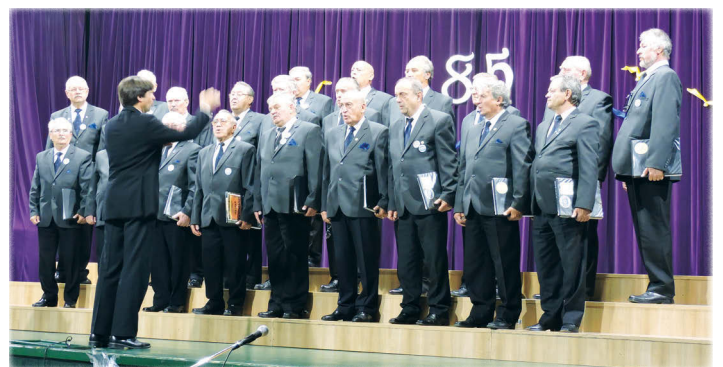
...a Sepsiszentgyörgyi Magyar FérfiDalárda,...