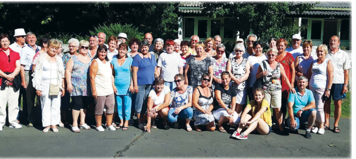
A soproni kirándulók