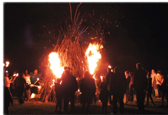
Az október elsejei ünnepség az örömtűz meggyújtásával zárult

sportélet iránti támogatását azóta is évről évre bizonyítja, és reméljük ez még hosszú évekig így is marad.