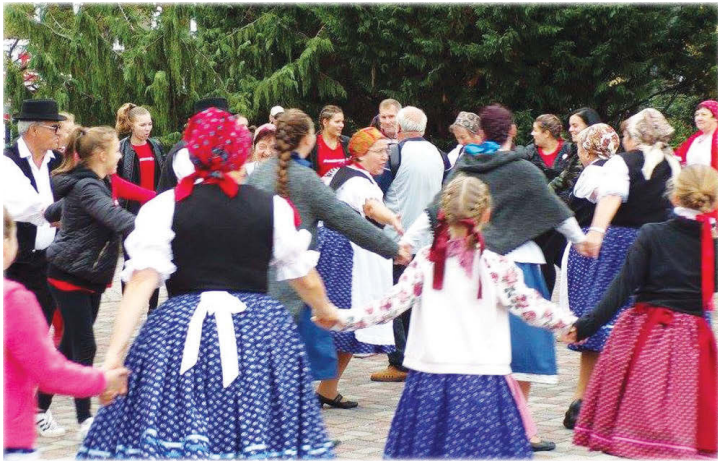
Közös tánc a Szent István téren

megnéztük többek között a schönbrunni kastélyt és parkját. Innen Bécs belvárosába mentünk, ahol megtekintettük a Hofburgot, a Szent István székesegyházat, a rózsakertet, a városházát, és sétáltunk a belvárosban. Lehetőség volt vásárolni a híres Manner csokoládéból, ezzel szinte mindenki élt is, hogy vigyünk haza az unokáknak egy kis ajándékot. A bécsi városnézés alatt a kitartó és lelkes csoport 23 465 lépést tett meg,