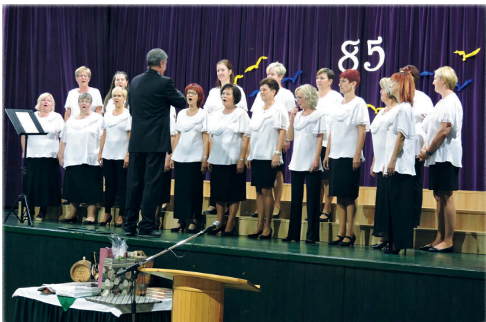
... fellépett a Napfény Női Kar ,...