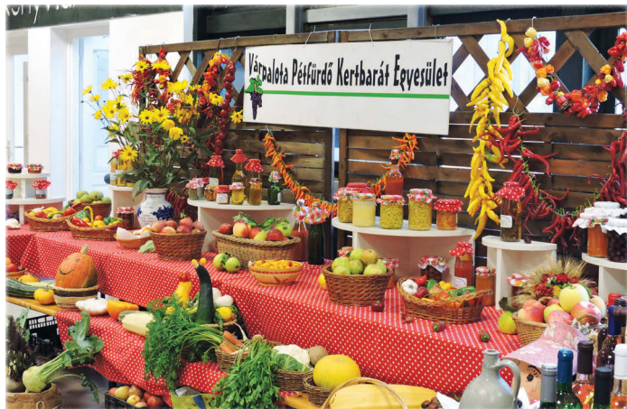
A Várpalota-Pétfürdői Kertbarát Kör terménybemutatója most is szemet gyönyörködtetőre sikeredett