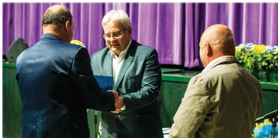
...és Medve József volt