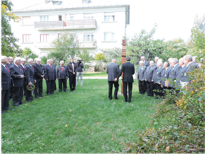
Az ünnepség előtt a Péti Férfikar és a Sepsiszentgyörgyi Magyar FérfiDalárda tagjai együtt emlékeztek meg elhunyt dalostársaikról, és megkoszorúzták az emléküket őrző kopjafát.

ban is bővelkedő, igazi zenei élményt nyújtó hangverseny képes-beszámolója következik.