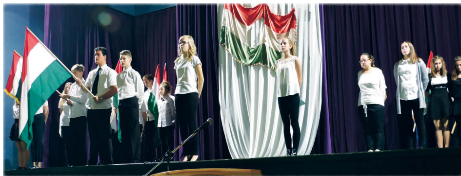
Az iskolások műsora