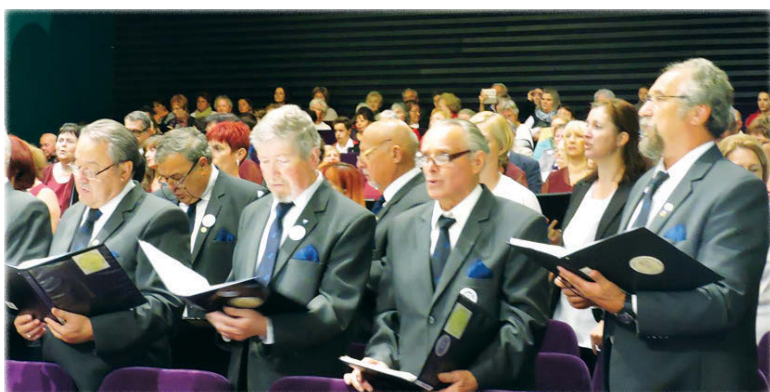
...Maros Rudolf: Háros felől című művét.