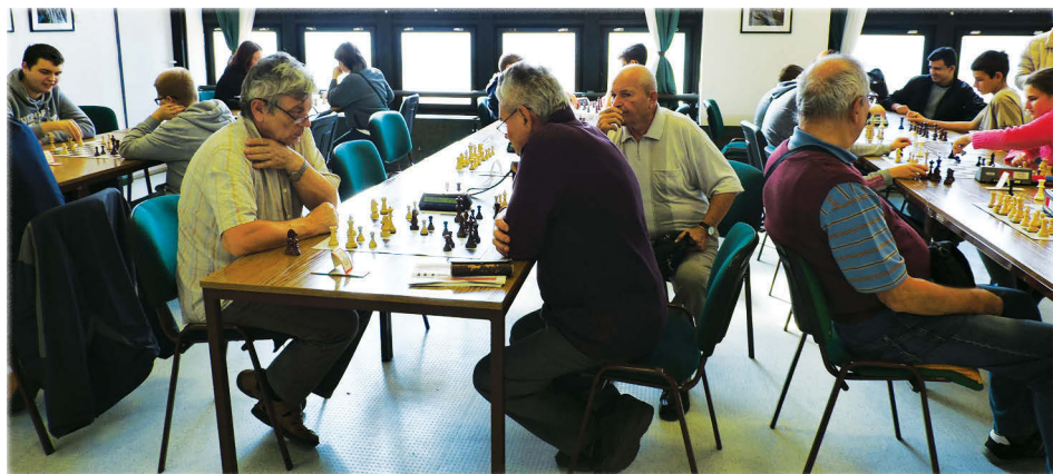
Pillanatfelvétel a sakkversenyről