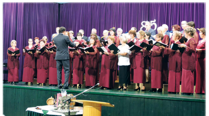
...a Várpalotai Bányász Kórus ,... »»»