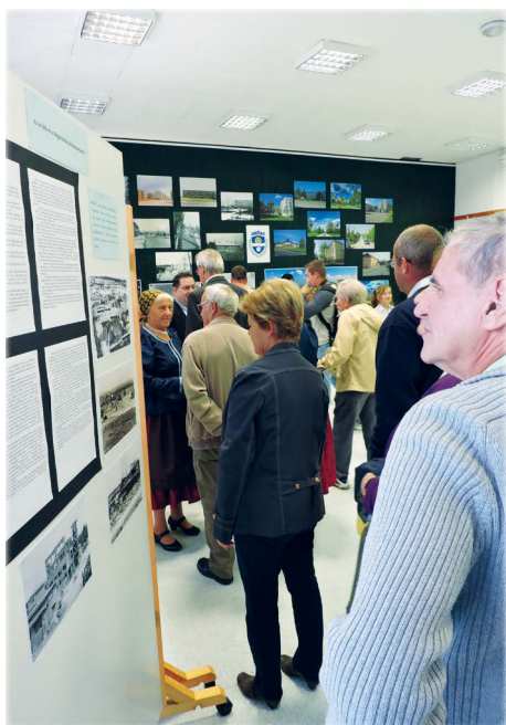
...Az elválás és a függetlenség dokumentumai című kiállítást