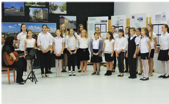
A Horváth István Általános Iskola énekkara Pétfürdő Himnuszát énekelte el