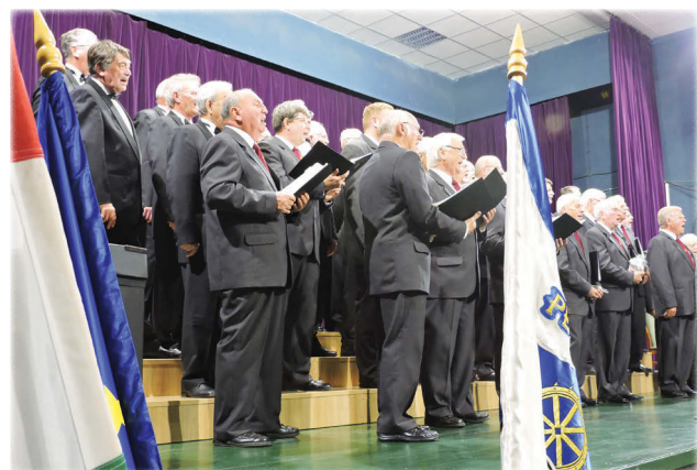
A koncert záróakkordjaként a kórusok együtt adták elő...