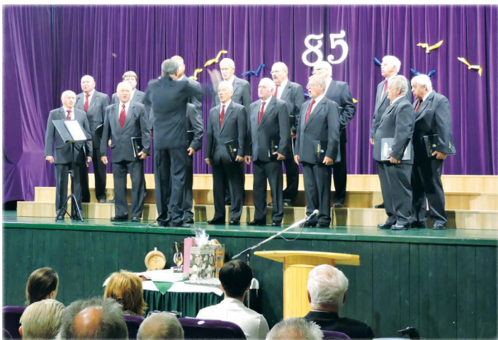
A születésnap hangversenyén a Péti Férfikar mellett...